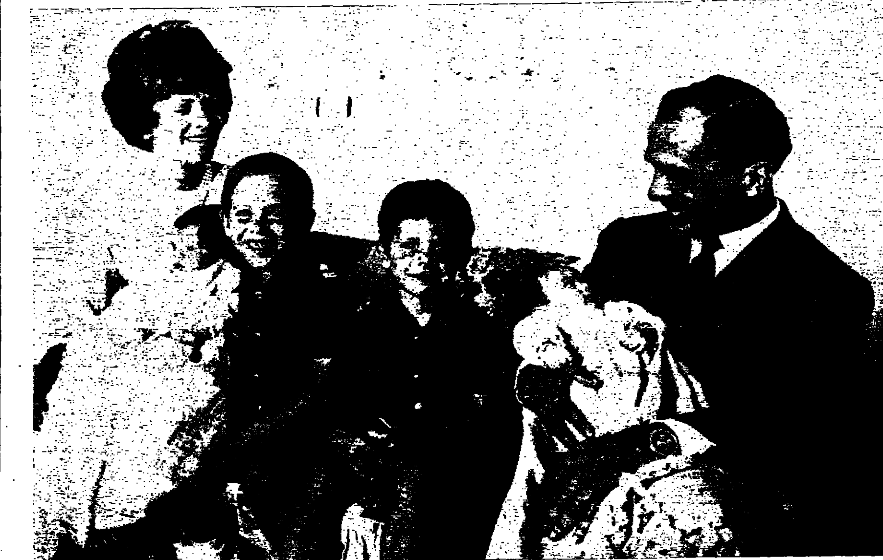
اول صورة تنشر لحالة الملك وسوا الامرة من العظمة وهما يحتضاناً بحنو وحضان صاحبتي السمو الاميرتين زين وعاشة بينما توسط الجميع صاحب السمو الاميران عبد الله ووفيل . امد الله في عمر جلالة الحسين وابقاه ابا عطوفاً لاسرته الهاتمية وأسرته الأردنية التي تكن له الحب والوفاء وتسعى وراء قيادته الحكيمه نحو النصر الاكيد